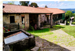
Casa de D. Ramón en Trasalba