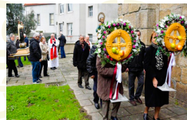
Procesión do Pan de Oseiro (Arteixo)

O tema é o estado da cuestión do Patrimonio Cultural de Galicia. Bases na web.