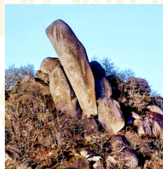
Pena Corneira (Leiro)

* 17 domingo: “Día das Letras Galegas” dedicado á xornalista Begoña Caamaño.