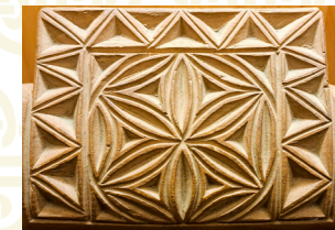
Detalle de canga